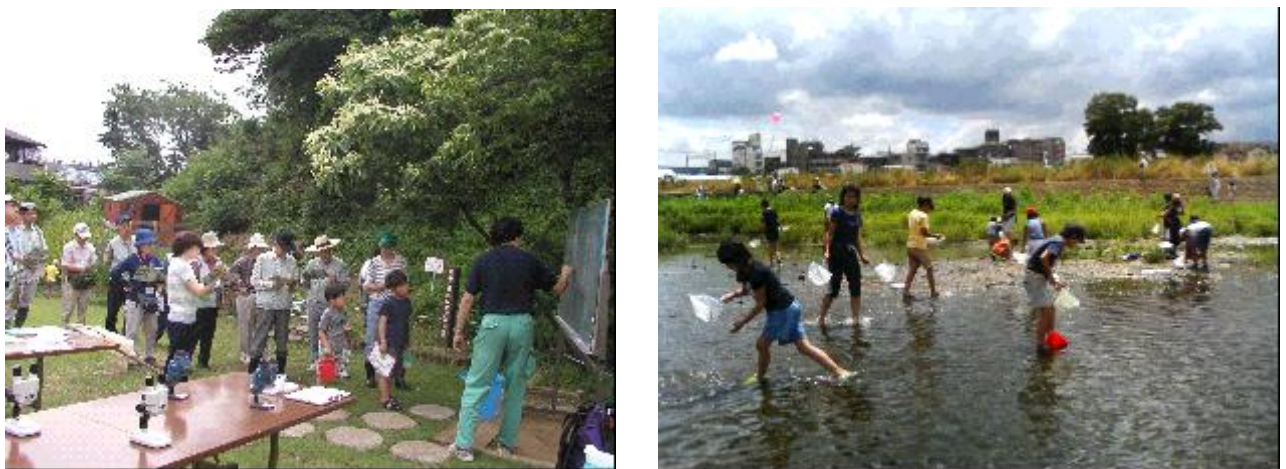
図2 野外実習の一コマ

近年は特に、地域の中から自分たちの身近な自然や水環境を知ろうという自発的な活動が盛んになってきている。地域の方々が川崎の魅力ある水辺を再発見しながら、楽しんで活動できるよう企画の段階から相談を受け、サポートしている。