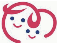
マザーズハローワーク

子育て中の方が、お子様連れでも安心して仕事探しができるように、 ベビーカーでも入れるレイアウトにしたハローワークです。 キッズコーナーや授乳スペースもあるので、安心して求人閲覧や職業相談ができるほか、 担当者制の就職支援サービスや就職活動に役立つ各種セミナーも開催しています。