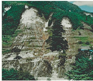
○山腹崩壊時の状況（昭和47年）