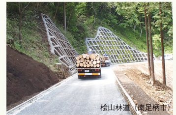
松山林道（南足柄市）