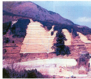
○山腹工施工状況（昭和49年）