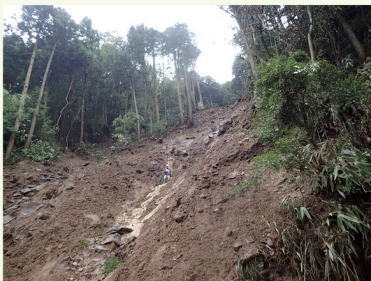
令和元年台風19号による水害状況(足柄下郡箱根町宮ノ下)

(注) 表中の「空欄」は、被害がないものを示す。年次(1月～12月)で集計している。