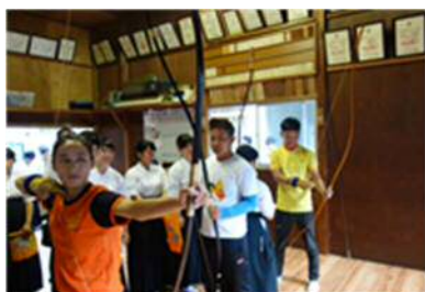
ブータン王国選手と地元高校生との交流事業の様子