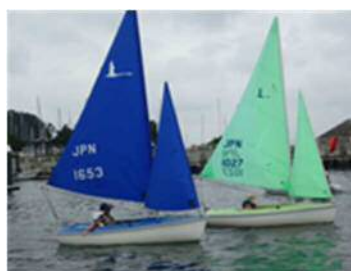
海上体験会の様子