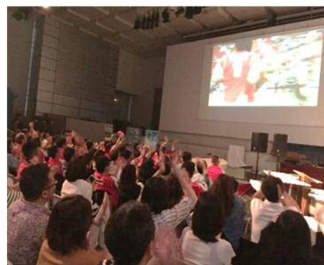
(パブリックビューイングの様子)

(注2) 開催自治体においてラグビーワールドカップ開催を周知するための装飾や演出（看板、横断幕、のぼり等の掲示等）。