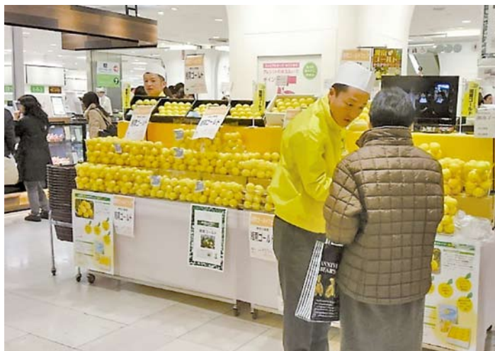
「湘南ゴールド」の販売の様子