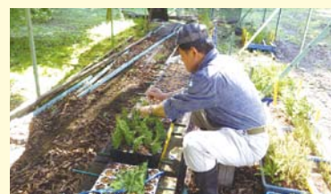
無花粉ヒノキのさし木による増殖