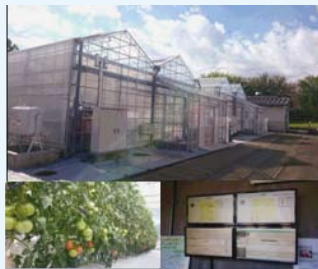
スマート農業の試験栽培を行う 「ICT温室」