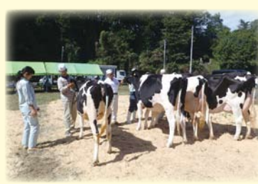
乳牛改良のための支援活動