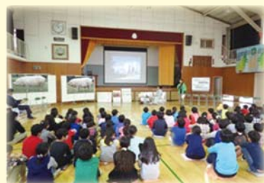
地産地消の醸成を図るための小学校での食育活動