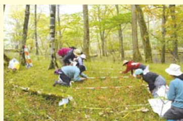
ブナ林の林床での更新木の生育調査

自然環境保全センターでは、ブナ林の保全・再生技術の開発や、森林の持つ水源のかん養等の多様な働きを向上させるための森林整備技術の改良、整備結果を評価するためのモニタリング調査を行っています。また、シカ等の野生動物と共存するための森林管理技術の研究や、花粉症対策として花粉を作らないスギやヒノキの種苗の実用化にも取り組んでおり、調査結果や成果に関する情報提供も行っています。