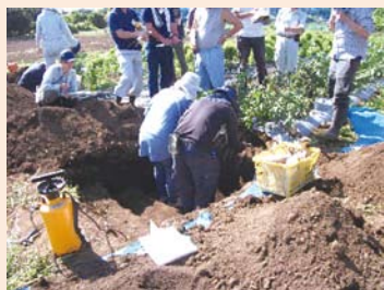
新規就農者向けセミナーの 現地実習