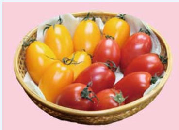
生食・加熱調理どちらでもおいしい トマト新品種「湘南ポモロン」