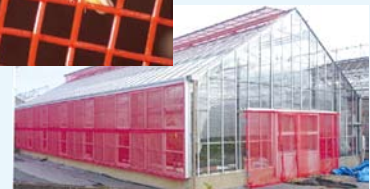
害虫が認識しない赤色に着目して 開発した「赤色防虫ネット」