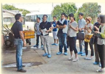
畜産後継者を対象とした6次産業化先進事例の視察