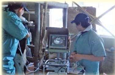
後継牛確保対策のための新技術（OPU）の実証