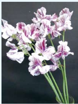
スイートピーの新品種 「スプラッシュヴィーノ」

県民に新鮮で安全・安心な農産物を安定して提供するための技術開発や、環境と調和した農業を推進するための技術開発に取り組んでいます。