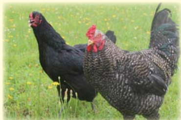
かながわ鶏の飼養管理技術の確立

また、研究成果及び新技術を生産者に普及させるとともに担い手の育成・確保に関する支援などを行っています。