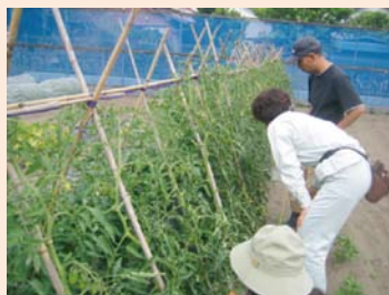
トマト生産者への巡回指導