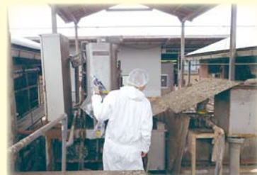
環境に調和する畜産を推進するための技術開発（臭気・粉塵現地調査）