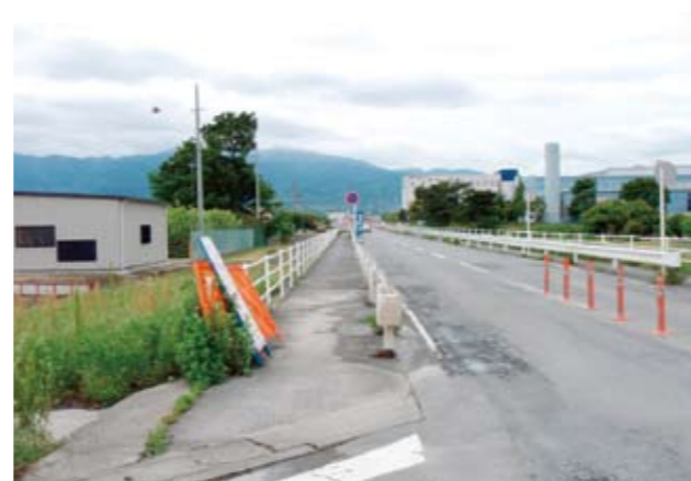
歩道が狭い道路(小田原市成田)