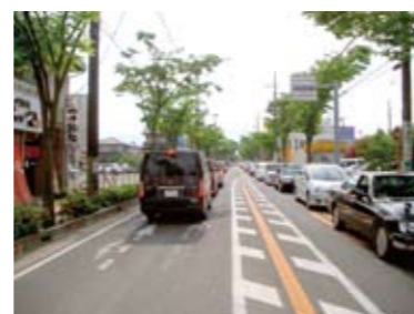
巡礼街道渋滞状況