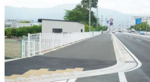
広い歩道が整備されている区間 (小田原市成田)