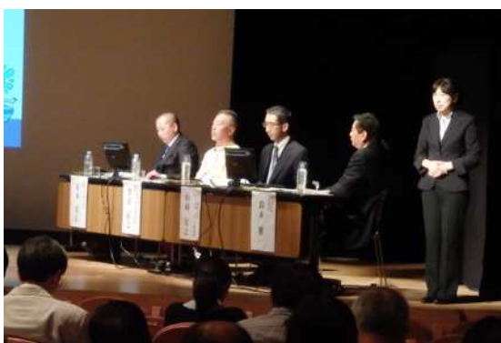
パネルディスカッション（パネリスト）