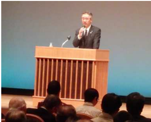
主催者あいさつ（浅羽副知事）