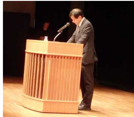
主催者あいさつ（浅枝副座長）