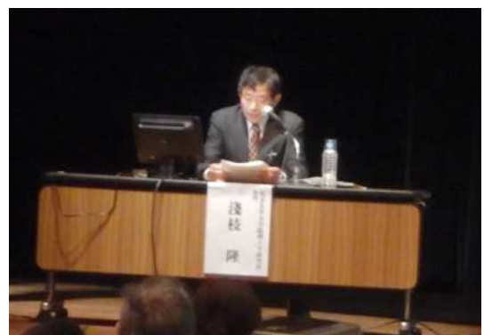
パネルディスカッション（コーディネーター）