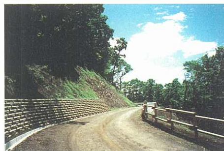
林道の計画的な整備（山北町）