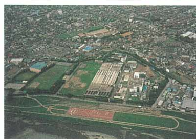
快適なくらしを支える下水道の整備 (酒匂川左岸処理場)