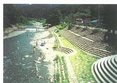
自然にやさしい溪流づくり（中津川）