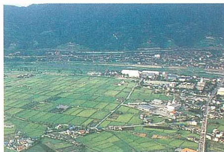
ほ場の整備の推進（酒匂川右岸地区）