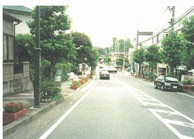
街路樹の整備（（都）城山曾比線）