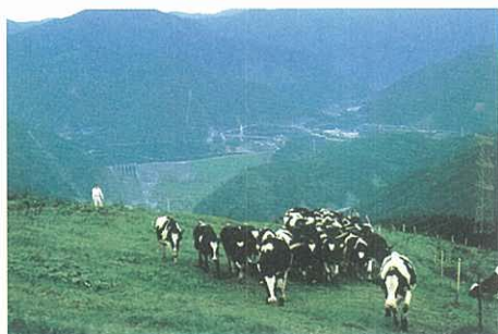
みどりのふるさとづくり(大野山乳牛育成牧場)