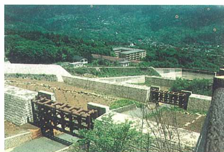
土砂災害防止施設の整備（須沢）