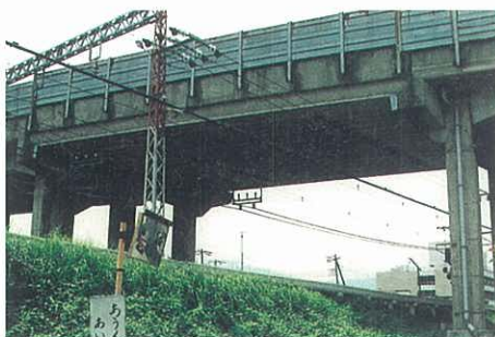
緊急輸送路となる橋りょうの整備 （国道255号松田高架橋）