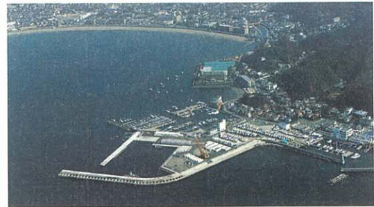
地方港湾の整備（葉山港）