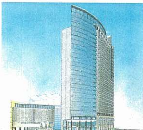
既成市街地の再整備による都市機能の更新（川崎駅西口地区）