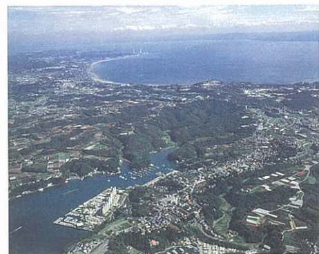
小網代の森の保全の推進（小網代） ほ場の整備の推進（三戸小網代地区）