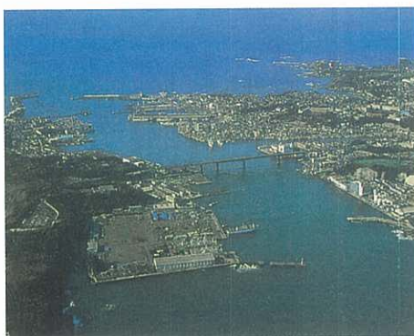
漁港の整備（三崎漁港）