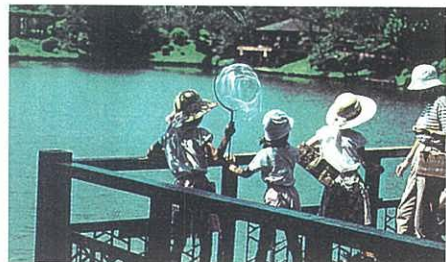
都市公園の整備（三ツ池公園）