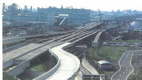
自動車専用道路網の整備 （川崎縦貫道路）