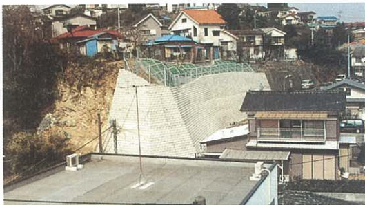
土砂災害防止施設の整備（横須賀市）