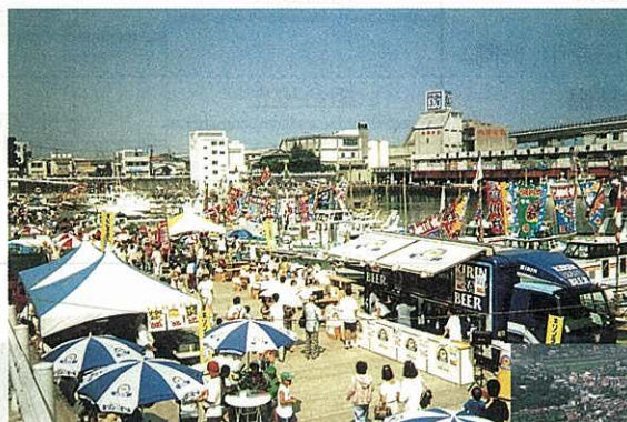
小田原みなとまつり