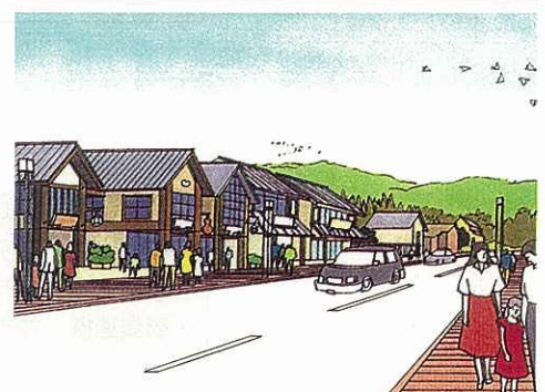
箱根地区街なみ環境整備のイメージ図