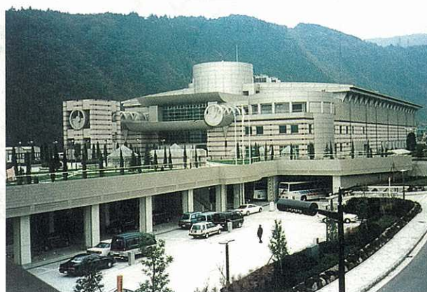
生命の星・地球博物館

生涯にわたり学習できる機会の拡大を図るとともに、生命の星・地球博物館や各種文化施設などの連携を促進して、身近なところで地域文化に触れることのできる環境づくりを進めるなど、伝統に培われた地域文化の発展に努めます。