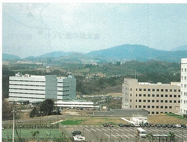
グリーンテックなかい

地域個性である美しい景観や豊かな田園環境と農村が培ってきた伝統的文化を生かした、神奈川のふるさとづくりを進め、体験農業や祭りなどによる都市住民との交流、高齢者との世代間交流による農村文化の伝承など、都市地域にはない個性的で魅力を持った開放的な地域づくりを進めます。