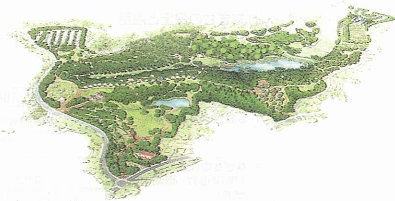
茅ヶ崎北部丘陵公園完成予想図