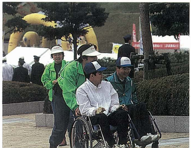
身体障害者スポーツ大会