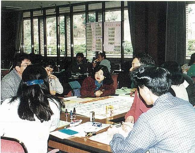
ヤングフォーラム (かながわ女性センター)