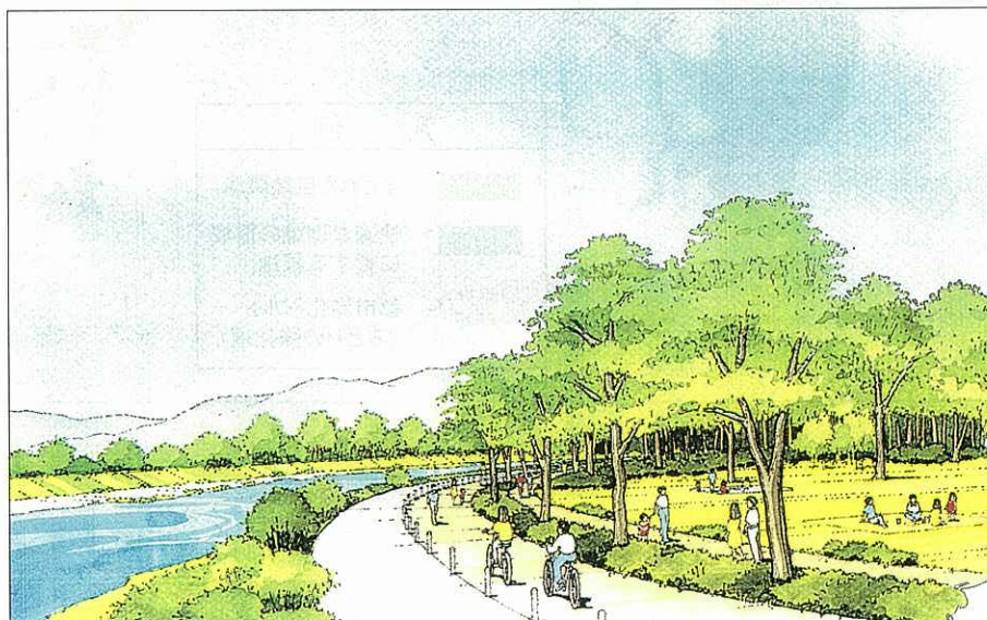
みどりの強化域における都市緑化(さがみグリーンライン)イメージ図