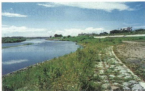
多自然型河川の整備 相模川