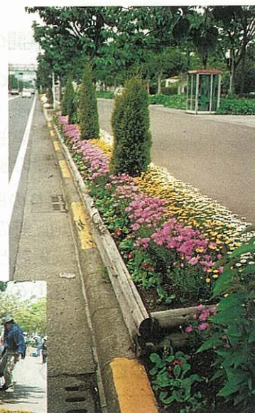
フラワーロードの整備