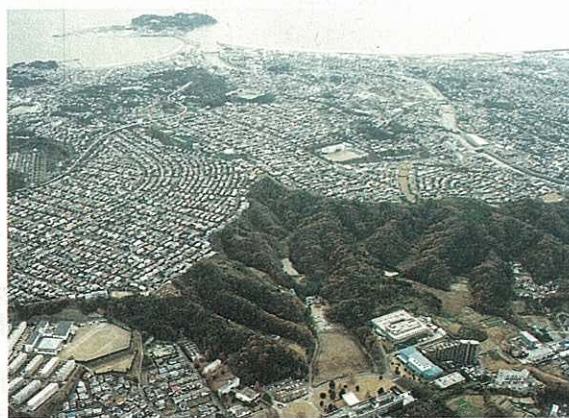
（財）かながわトラストみどり財団が保全を進めている 藤沢市片瀬・川名緑地