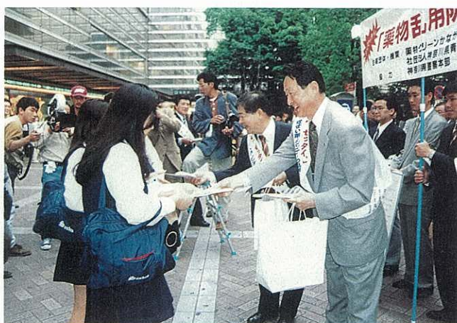
薬物乱用防止緊急アピール行動