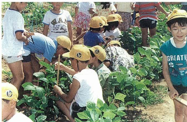
県立足柄ふれあいの村における収穫体験活動