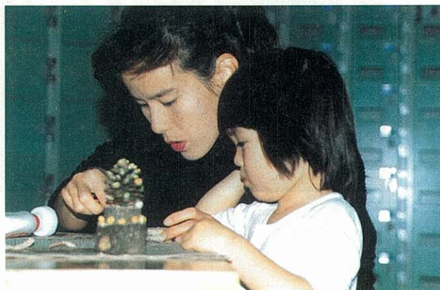
藤野芸術の家の体験活動