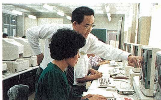
知識・技術のリフレッシュ～パソコン教室で学ぶ人たち (藤沢工業高校コミュニティスクール)

教養アップや職業能力アップなど多様化・増大する県民の学習ニーズに対応し、学ぶ機会や場の提供の拡充を図るため、県立の機関や学校が有する人材・施設の活用や、生涯を通じていつでも大学や大学院の教育を受けられるようなくみづくりを進めるとともに、社会教育指導者や生涯学習ボランティア等の学習支援者の育成を図ります。