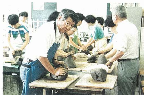
陶芸教室で学ぶ人たち (白山高校コミュニティスクール)