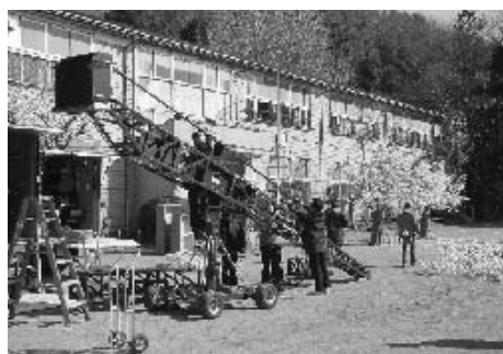
藤野フィルムコミッション事業の推進