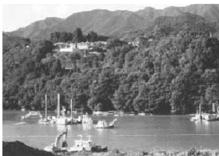
ダム貯水池の堆砂対策(堆積土砂の除去)