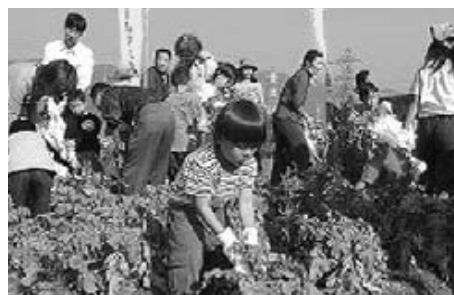
交流イベント(さがみこファームフェスタ)