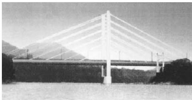
橋りょうの架替 県道520号(勝瀬橋)完成予想図