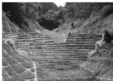
間伐材を使った谷止工（串川地域）