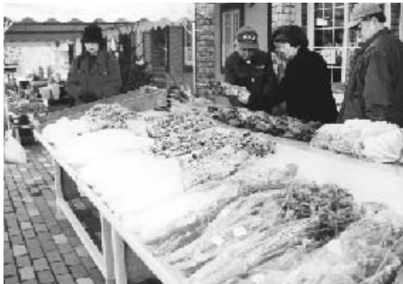
鳥居原ふれあいの館(直売所)