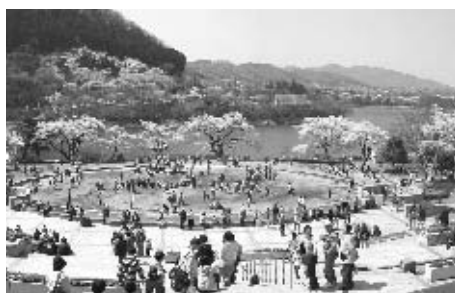
県立津久井湖城山公園(水の苑地)