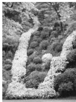
正覚寺滝つつじ（観光スポット）