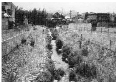
境川多自然型護岸整備