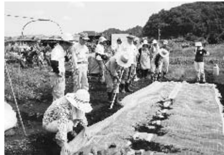
中高年ホームファーマーの育成と農園整備