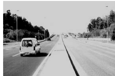
都市計画道路藤沢厚木線

また、NPOなどと協働し、地域の魅力を再発見する「まちあるき」や「相模湾海辺の環境学習フォーラム」などを実施するとともに、みなとまちづくり協議会によるイベントを開催しました。さらに、環境モデル都市ツインシティの特定保留区域設定に向けた都市計画の素案を作成するとともに、環境実態調査に着手しました。