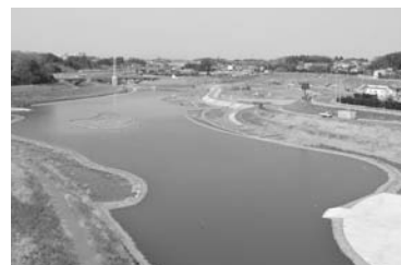
境川遊水地・下飯田遊水地

金目川、境川、引地川などの護岸や遊水地の整備を行うとともに、藤沢海岸に津波情報盤を設置しました。また、海岸侵食対策として、平塚海岸にヘッドランドの整備を行いました。さらに、東沢で土砂災害を防止する施設の整備を進めました。