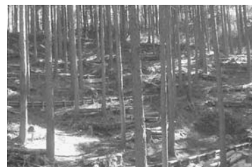
水源林整備・伊勢原市日向

また、水源の森林エリア内において、手入れ不足の私有林の公的管理・支援を進めました。さらに、砂浜の回復・保全のため、砂浜の砂の流れの広域的な調査を実施するとともに、茅ヶ崎海岸などにおいて、養浜を実施しました。