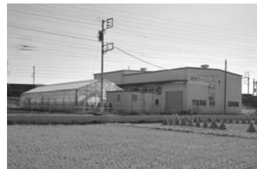
水稻の育苗、乾燥などを行う湘南ライスセンター

また、西部方面職業技術校（仮称）や伊勢原市大田地区のほ場の整備（*2）、トマトの低コストハウスやライスセンターの整備に対する支援、家畜排せつ物を活用するための堆肥化施設の整備支援などを行いました。