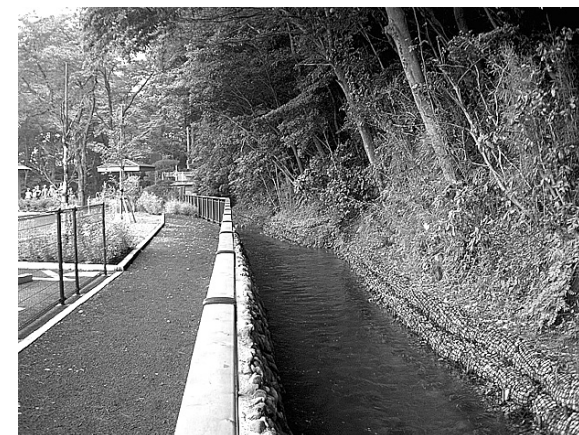
⑧ 望地地区のうらい施設の整備