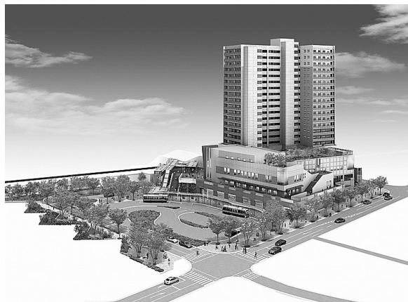
⑬ 小田急相模原駅北口A地区市街地再開発事業