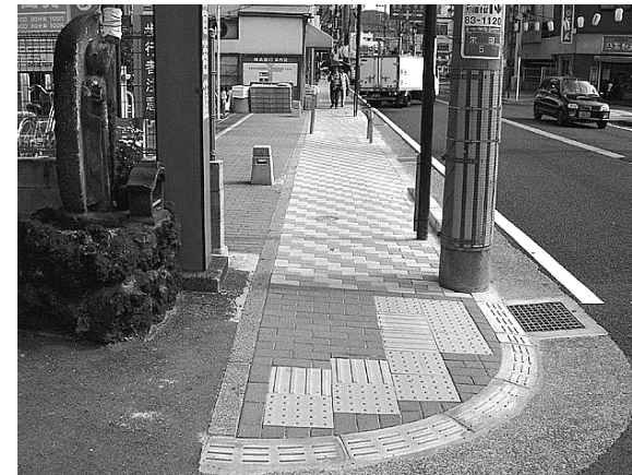
⑤ 県道704号(秦野停車場) 歩道のバリアフリー化