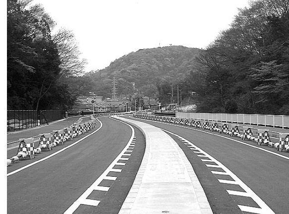
⑪（都）久里浜田浦線整備