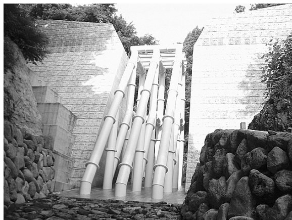
② 滝沢川えん堤整備