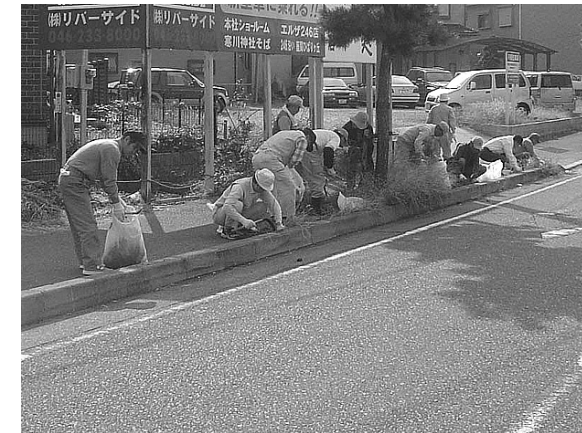
⑰ 県道45号（相模原茅ヶ崎）きれいな道づくり活動