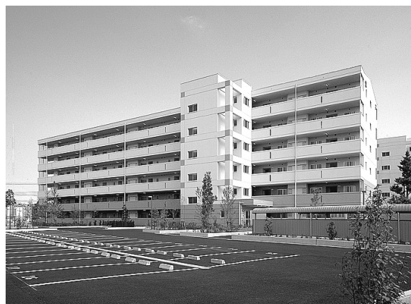
⑭ 小向団地第二期建替え工事