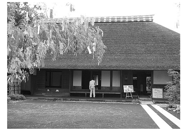
⑥ 金井島地区の瀬戸屋敷の整備