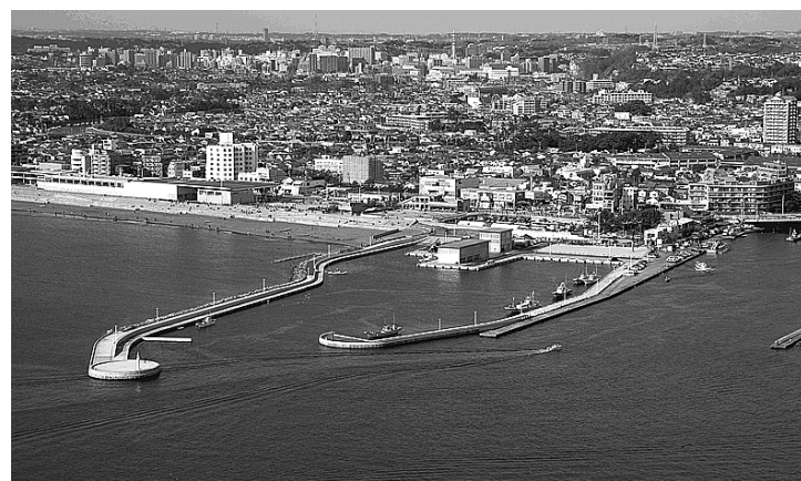
④ 災害に強い漁港の整備(片瀬漁港)