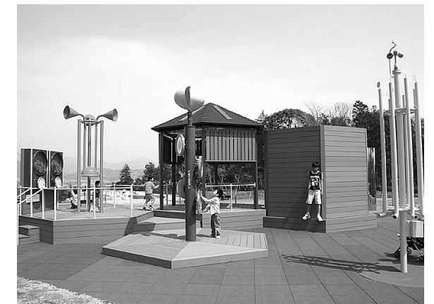
⑯ 県立おだわら諏訪の原公園