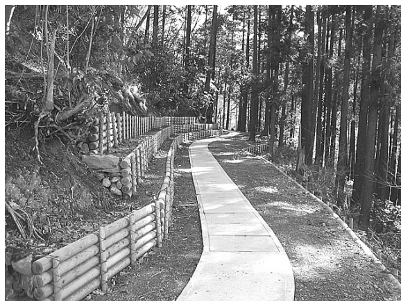
③ 煤ヶ谷地区の水路整備