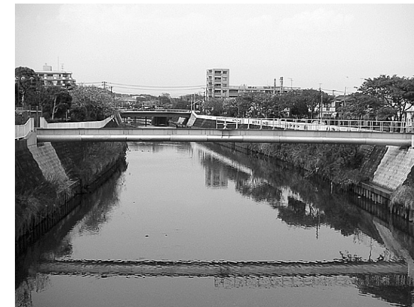
⑮ 藤沢市辻堂西海岸地内配水管布設（水管橋）工事