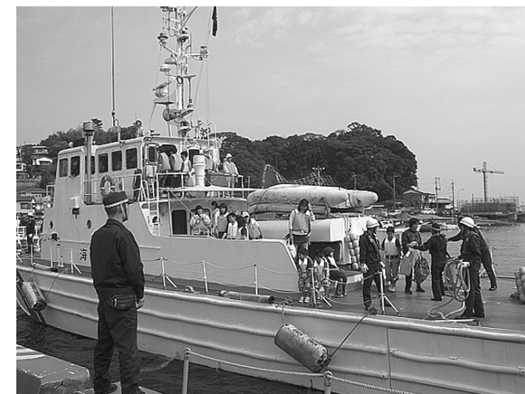
⑨ 真鶴港みなとまちづくり