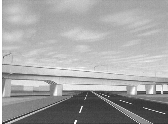
⑩ 河原口立体（（都）下今泉門沢橋線）