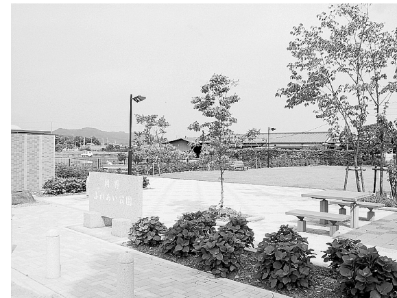
⑦ 岡野ふれあい公園(農村公園)の整備