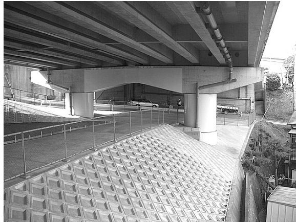
① 県道71号(秦野二宮) [木戸陸橋] 耐震補強

「神奈川力構想・プロジェクト51」では、「主な施策・事業体系」のうち、県民の皆さんの関心の高い都市整備などの施策・事業について、その整備の方向と地域別事業概要を明らかにしました。 これらの施策・事業のうち、2004～2006年度に実施・完成または着手した主な事業をご紹介します。