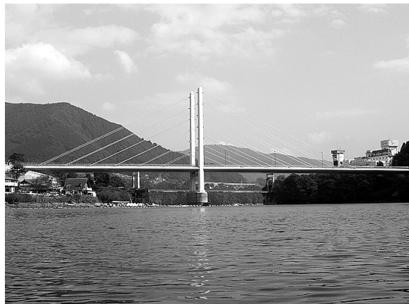
⑫ 勝瀬橋（県道520号（吉野上野原停車場））整備