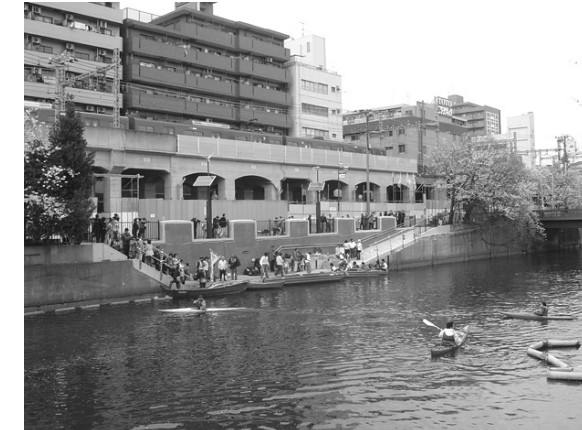
⑱ 大岡川黄金町地区親水施設