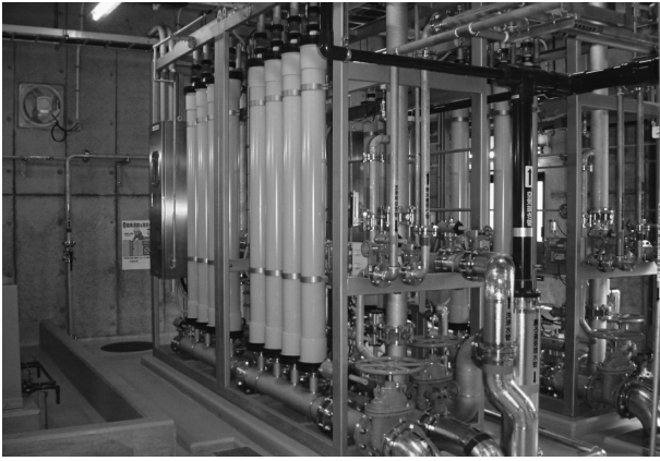
⑮イタリー水源膜ろ過設備整備