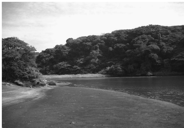
⑧小網代の森の保全(近郊緑地保全区域指定)