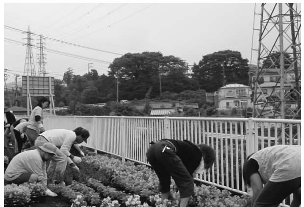
⑱県道74号(小田原山北)フラワーロード活動