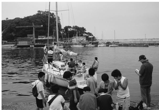
⑨地方港湾四港(葉山港・湘南港・大磯港・真鶴港)