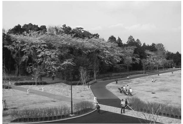
⑰県立おだわら諏訪の原公園 一部開園