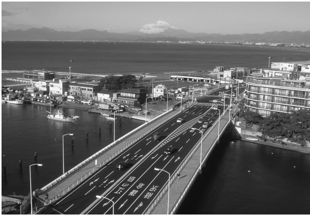
⑪国道134号(片瀬橋)整備