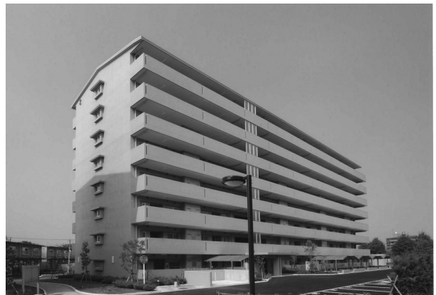
⑭県営横山団地第一期建設工事

●多様な交流を支える道路網の整備 ○インターチェンジ接続道路の整備 ・(都)湘南新道 〈平塚市四之宮～真土〉(写真⑩) 2005年10月部分供用 ○交流幹線道路網の整備 ・国道134号(片瀬橋) 〈藤沢市片瀬海岸〉(写真⑪) 2005年12月完成 ○地域分断・交通のボトルネックの解消 ・酒匂川2号橋(県道711号(小田原松田)) 〈開成町吉田島～大井町金手〉(写真⑫) 2006年整備開始 ●地域の個性を生かした市街地の整備 ○既成市街地の再整備による都市機能の更新 ・紅谷町三番地区優良建築物等整備事業 〈平塚市紅谷町三番一ほか〉(写真⑬) 2005年8月完成 ●豊かで多様な住まいづくり ○的確な公営住宅の整備 ・県営横山団地第一期建設工事 〈相模原市横山四丁目〉(写真⑭) 2005年8月完成