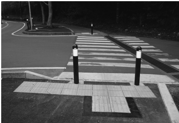
⑤県道214号(武上宮田)歩道バリアフリー化