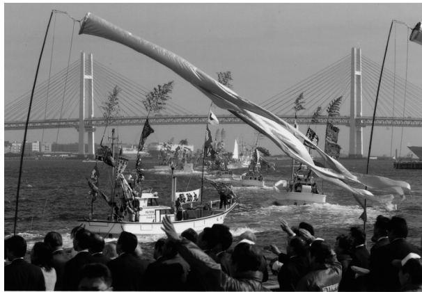
⑥第25回全国豊かな海づくり大会