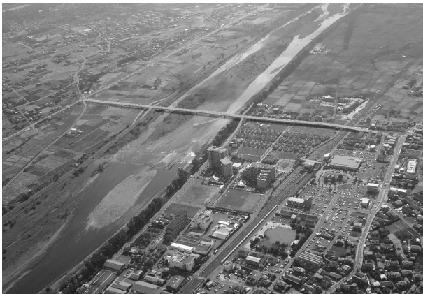
⑫酒匂川2号橋 完成イメージ図