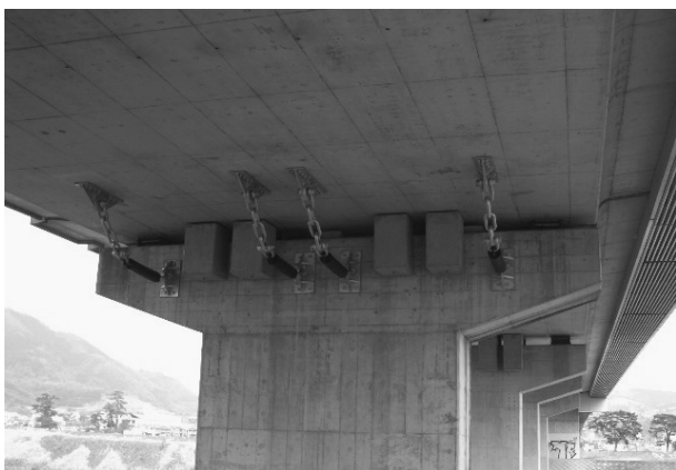
①県道78号(御殿場大井)〈足柄大橋〉耐震補強

これらの施策・事業のうち、2005年度に完成した主な事業と2006年度に完成または着手する予定の主な事業をご紹介します。