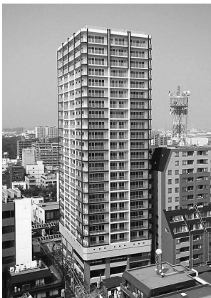
⑬紅谷町三番地区優良建築物等整備事業

●多様な交流を支える道路網の整備 ○インターチェンジ接続道路の整備 ・(都)湘南新道 〈平塚市四之宮～真土〉(写真⑩) 2005年10月部分供用 ○交流幹線道路網の整備 ・国道134号(片瀬橋) 〈藤沢市片瀬海岸〉(写真⑪) 2005年12月完成 ○地域分断・交通のボトルネックの解消 ・酒匂川2号橋(県道711号(小田原松田)) 〈開成町吉田島～大井町金手〉(写真⑫) 2006年整備開始 ●地域の個性を生かした市街地の整備 ○既成市街地の再整備による都市機能の更新 ・紅谷町三番地区優良建築物等整備事業 〈平塚市紅谷町三番一ほか〉(写真⑬) 2005年8月完成 ●豊かで多様な住まいづくり ○的確な公営住宅の整備 ・県営横山団地第一期建設工事 〈相模原市横山四丁目〉(写真⑭) 2005年8月完成