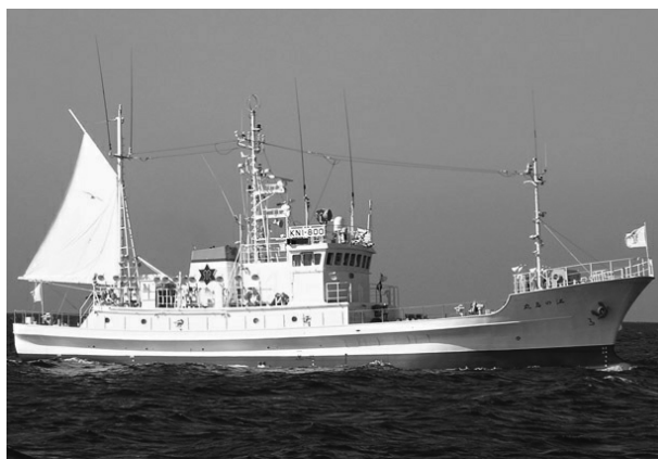
⑦漁業調査指導船「江の島丸」竣工