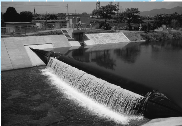
④大堰地区の取水堰の改修