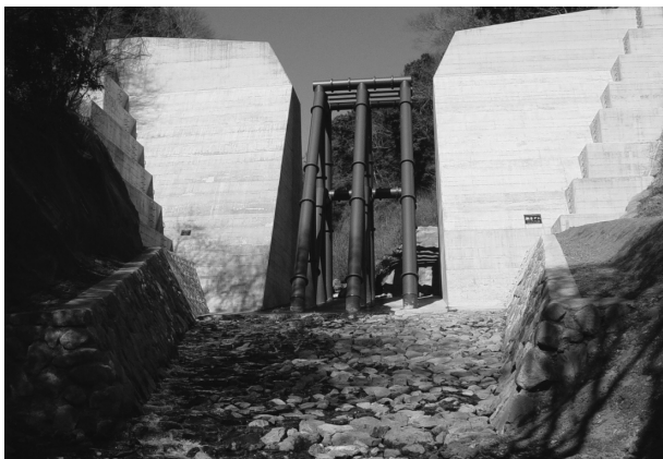
②勘三郎沢えん堤整備