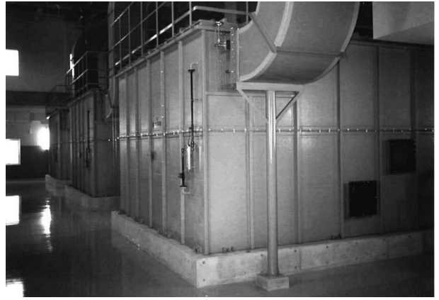
⑯相模川流域下水道左岸処理場水処理施設脱臭設備設置