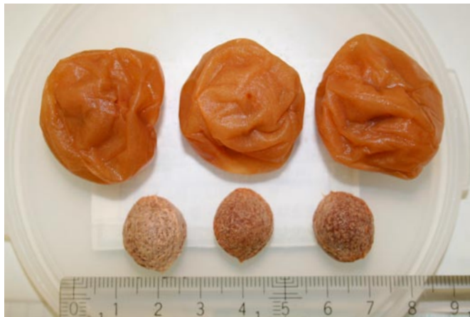
図5 ‘十郎小町’の梅干し

果実重は48g程度で、‘南高’とほぼ同程度の大粒となる。果形は短楕円形で、陽光面の果皮着色は‘南高’より少ない。核重率は5.7%となり、核が極めて小さい点の特徴である。ヤニ果(外ヤニ)の発生率は0.6%と極めて少ない(表2, 図4)。