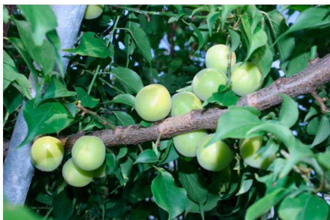
図1 ‘十郎小町’の着果状況

z ‘十郎小町’は小田原市上曾我(2007, 2009, 2011年)、他の品種は神奈川県農業技術センター(平塚市・2009~2011年)のデータ