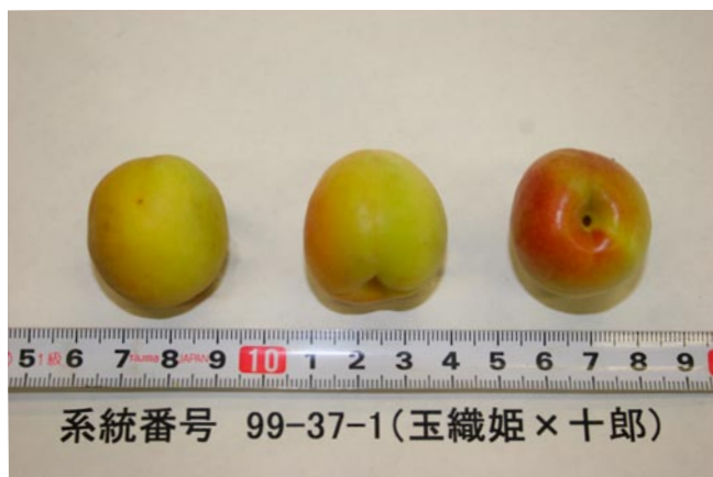
図2 ‘十郎小町’の果実外観