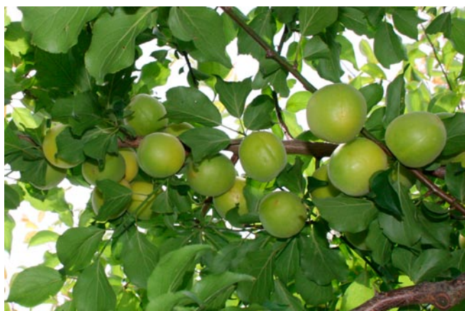
図3 ‘虎子姫’の着果状況