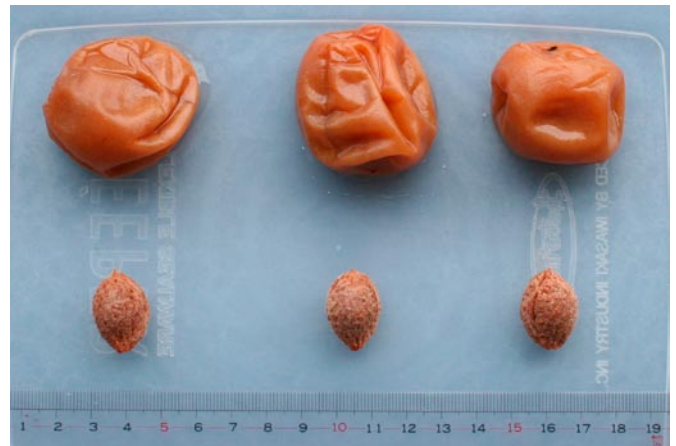
図6 ‘虎子姫’の梅干し

‘十郎小町’は和歌山産‘南高’より早く市場出荷できるため、有利販売が可能な品種として導入が見込まれる。また、小田原市でブランド化を進めている‘十郎’の姉妹品種としても期待される。