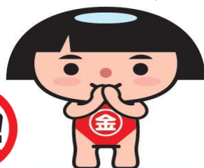
神奈川県PRキャラクター かながわキンタロウ