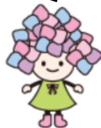
開成町公式マスコットキャラクター あじさいちゃん