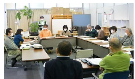
セルフチェックによる組織課題の可視化と 組織のリデザイン事業