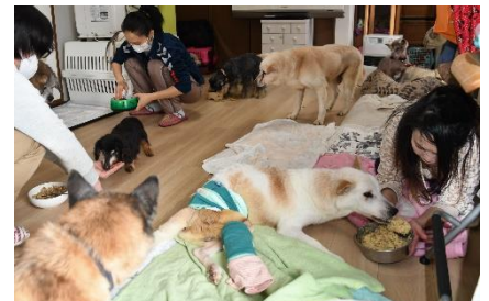
老犬猫及び傷病犬猫を介護するケアハウス事業