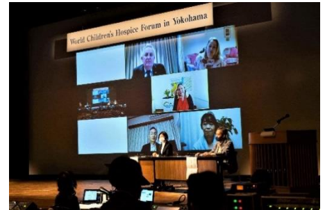
横浜こどもホスピス設立に向けた世界フォーラム