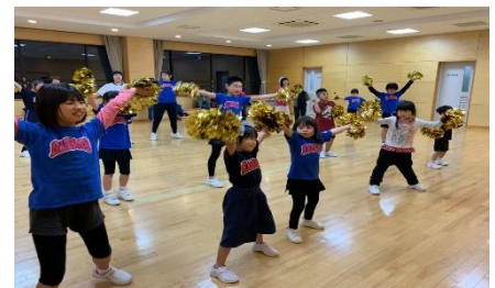
障がいのある子どもたちを対象とした チャレンジドチア・パラチア普及事業の実施