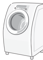
洗濯機・衣類乾燥機