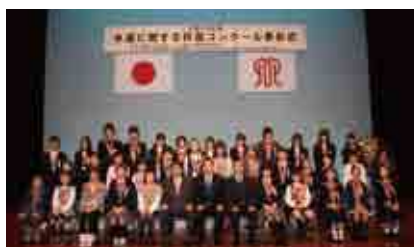
入賞者の皆さん (平成23年11月20日の表彰式)

http://www.pref.kanagawa.jp/cnt/f41151/p28574.html