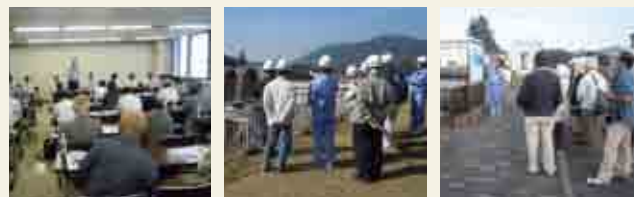
5月13日 第1回会議のようす 11月2日 施設見学会(城山ダム、谷ヶ原浄水場)のようす

詳しい活動内容はホームページで紹介しています。ぜひご覧ください。 http://www.pref.kanagawa.jp/cnt/f41151/p28637.html