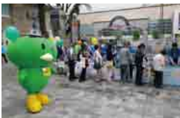
6月3日 小田急線本厚木駅北口

なお、各会場で行いました「東日本大震災義援金」募金113,427円は、社会福祉法人神奈川県共同募金会へお届けしました。ご来場いただいた皆さまからの温かいご厚意に感謝いたします。誠にありがとうございました。