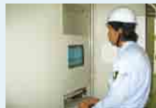
ダムの計測データを確認しています