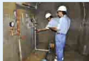
ダムの内部で計器の点検をしています