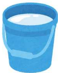
10L バケツ ペットボトルのキャップ (1杯:約 5mL)