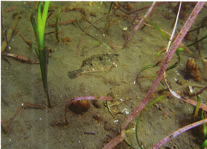
造成アマモ場で夏を越したマコガレイ (小田和湾)