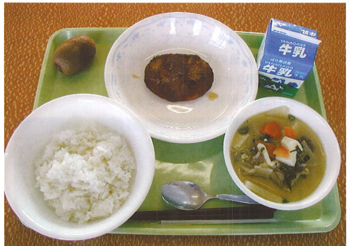
学校給食献立 鰹ハンバーグ (小田原市)