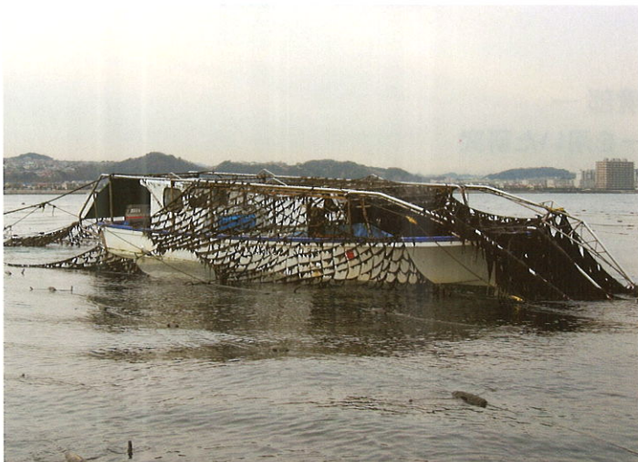
スサビノリの刈り取り (東京湾)