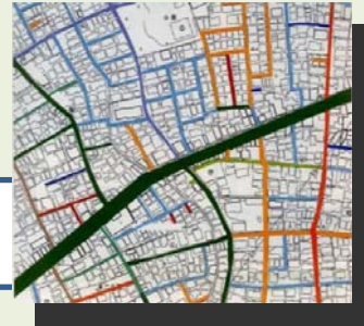
【指定道路図・イメージ図】