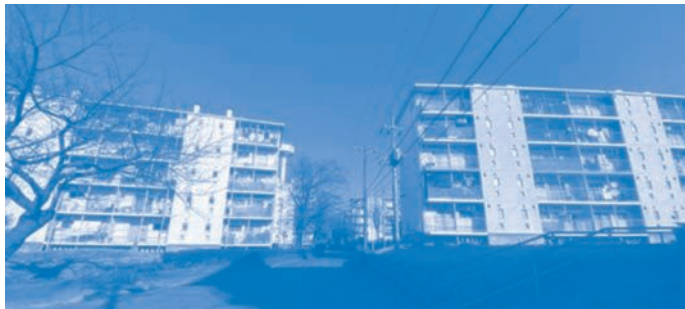
鉄筋コンクリート造の県営住宅