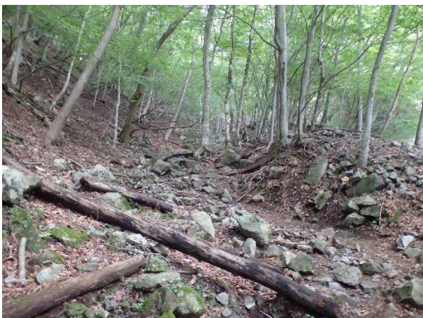
(写真6) 犬越路への登山道

●登山等後半は沢から離れて岩の多い谷筋を歩きます。この日は歩くたびに蒸し暑くなりました。しっかりと水分・塩分補修を行い無理のないペースで歩きましょう。(写真6)