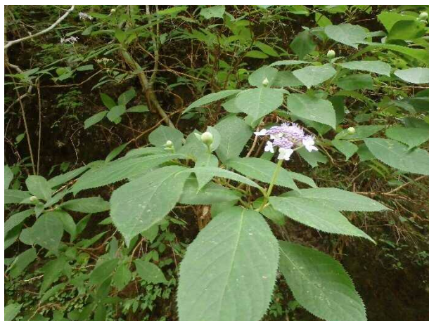
(写真7) タマアジサイ