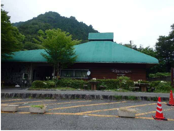
(写真3) 西丹沢ビジターセンター(旧西丹沢自然教室)