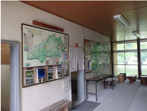
(写真4) 休館日でもトイレや掲示板は利用できます