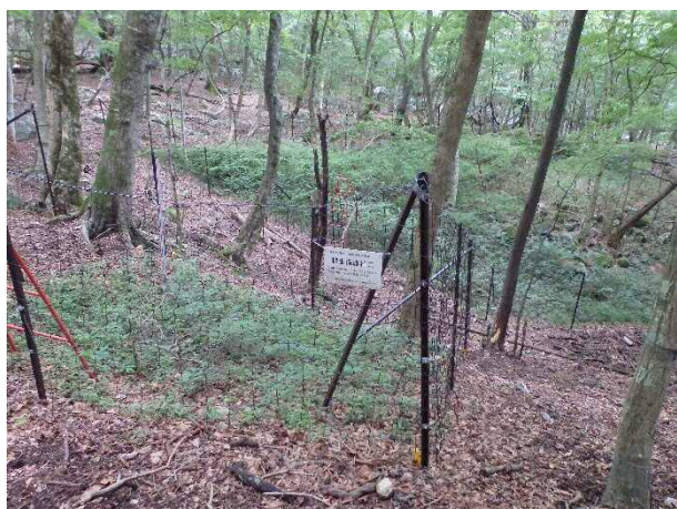
(写真8) 植生保護柵(平成20年設置)