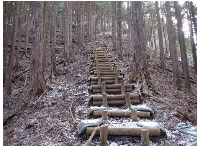
ダルマ沢ノ頭への急登