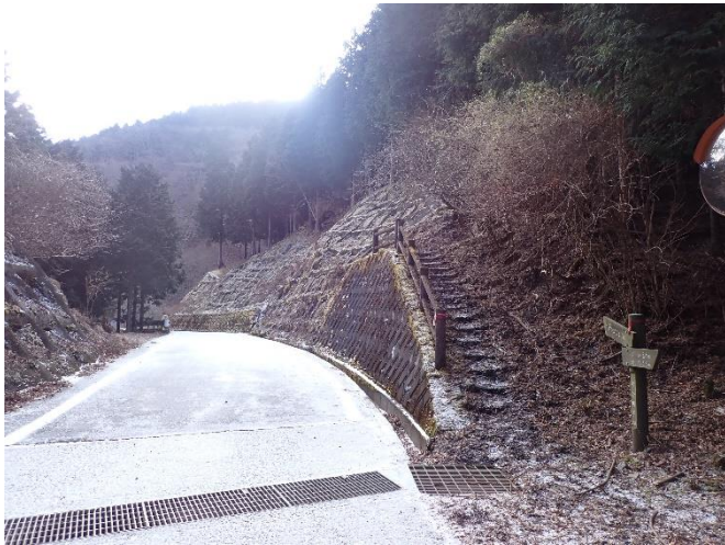
林道秦野峠登山口