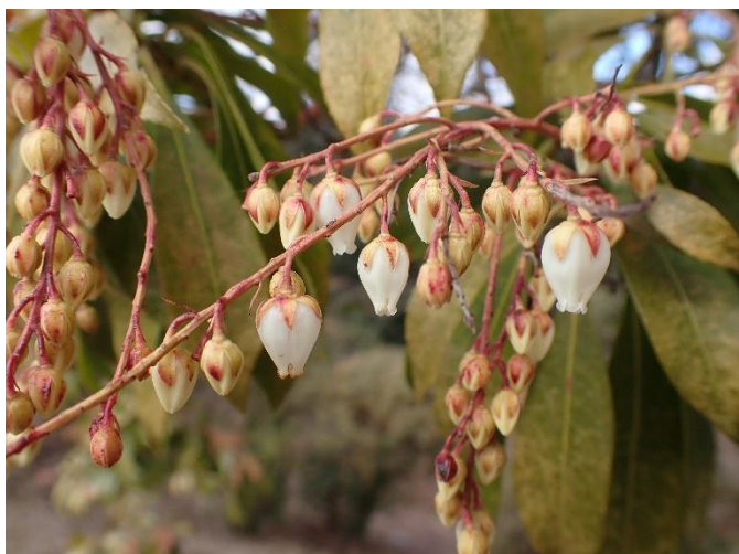
数輪咲いていたアセビ