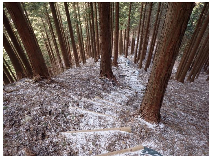
登ったと思ったら、今度は下りです