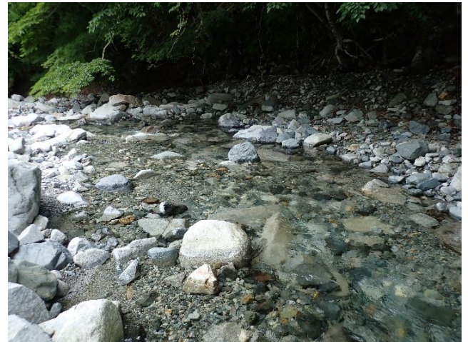
沢の水はとても澄んでいます