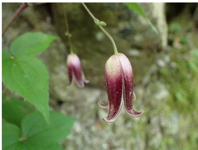
ハンショウヅル 名前は小さな釣鐘の半鐘（ハンショウ）から