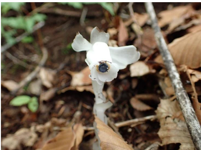
ギンリョウソウ どちらも葉緑素を持たず、土壌の菌類や木の根に寄生して栄養をもらっています。