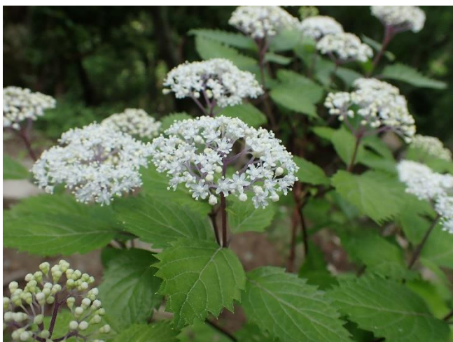
コアジサイ 花火のような小さなアジサイです

●梅雨ならではのアジサイや変わった植物、この時期目立つ白い花などが咲いていました。