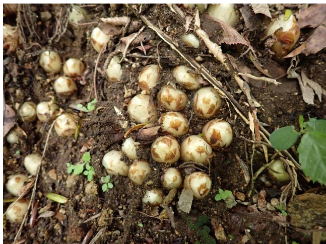
キヨスミウツボのつぼみ