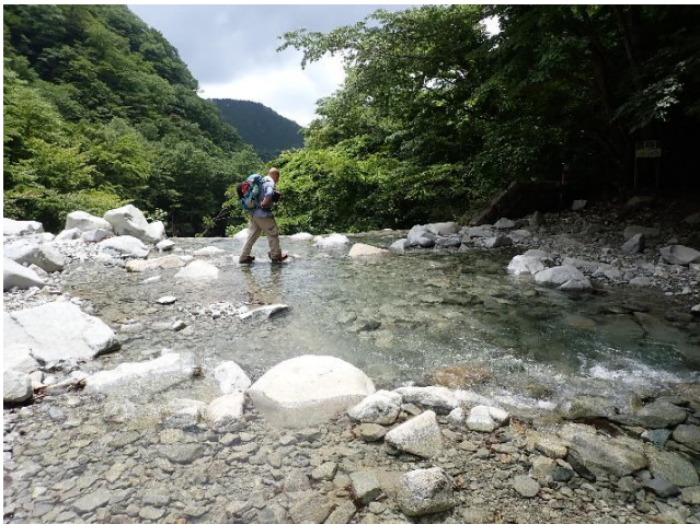
ゴーラ沢出合渡渉箇所