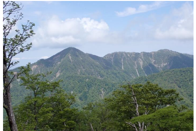
付近からは蛭ヶ岳や丹沢主脈が見えます