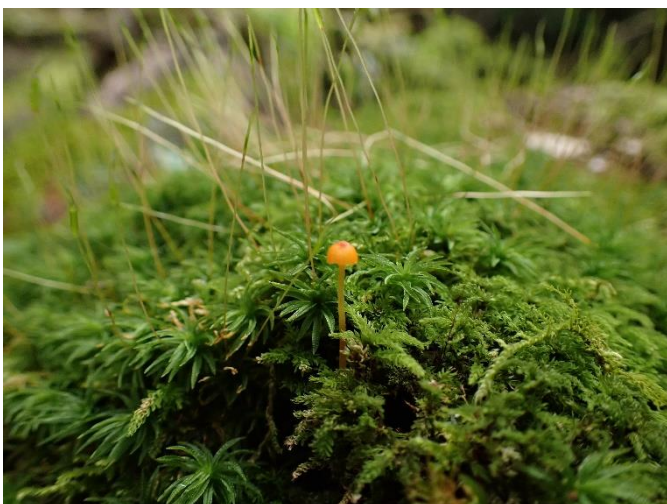
コケの上の小さなキノコ

時には視点を改めてマクロな世界をのぞいてみると、新たな発見があるかも知れません。