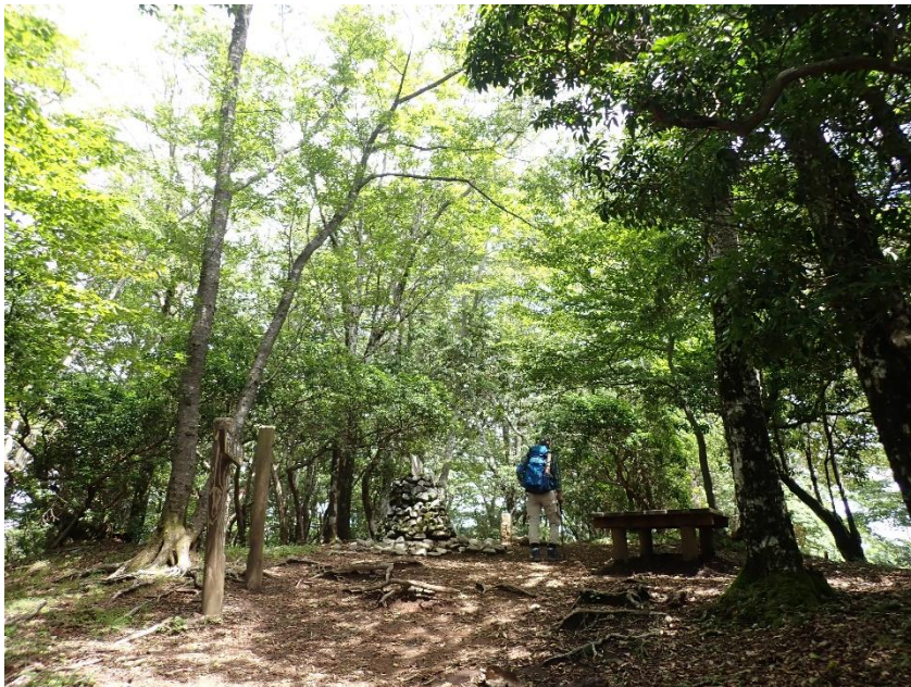
畦ヶ丸山頂の様子