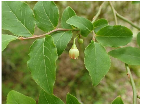
スノキ（これもつつじの仲間）