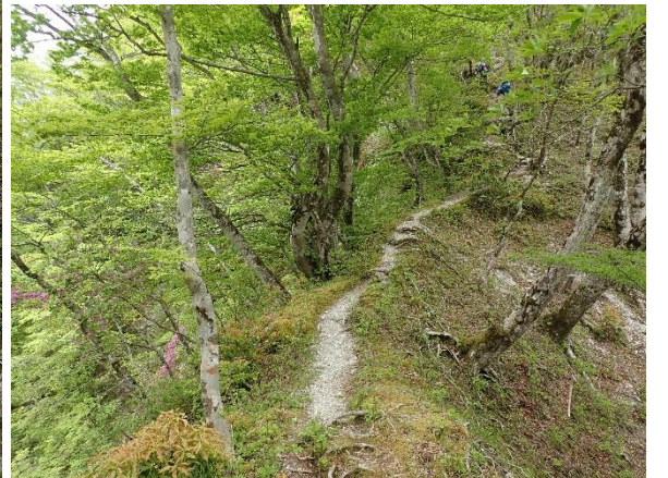
雨山峠から鍋割峠まではヤセ尾根や長いクサリ場があるスリリングな登山道