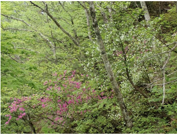
写真右上：トウゴクミツバツツジ 左上：シロヤシオ 左下：2種の競演