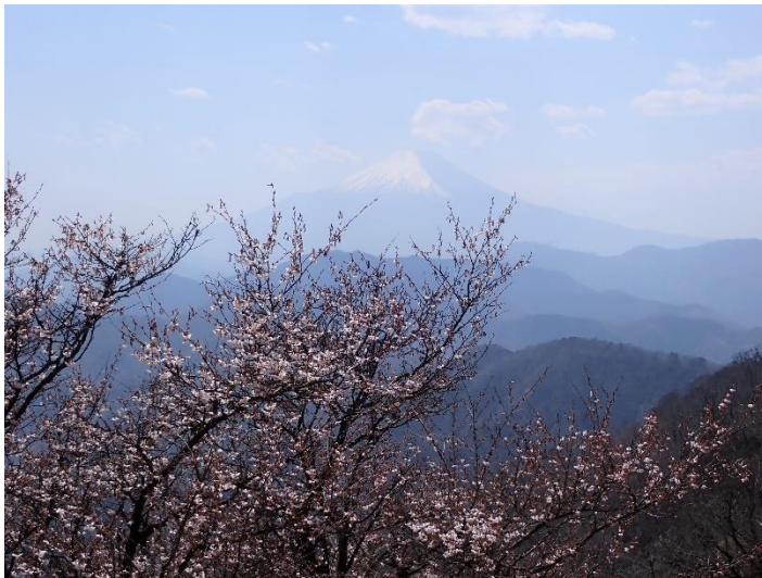
マメザクラ（フジザクラ）と富士山

●マメザクラの開花は山頂付近まで進みました。別名をフジザクラといい、富士山や箱根・丹沢周辺特有のサクラです。