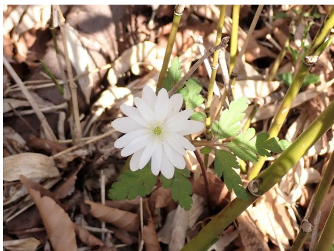
キクザキイチゲ 花の色は白から青紫と2種類あります。