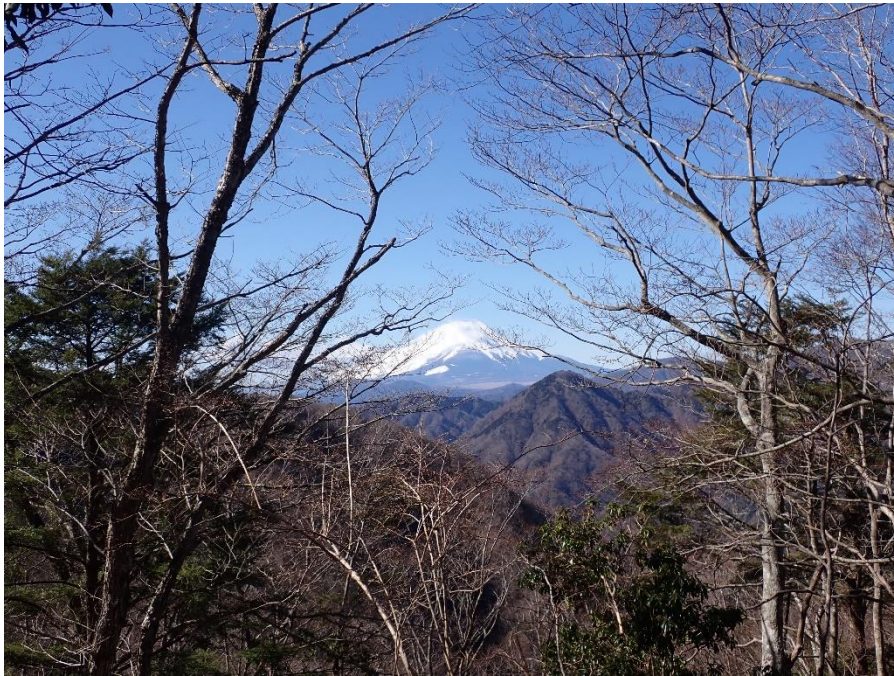
展望園地から見た富士山