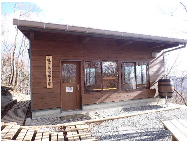
畦ヶ丸避難小屋の外観

●建て替え工事をしていた畦ヶ丸避難小屋が令和2年10月16日に供用開始となりました。小屋はとてもきれいに使用していただき、木の香りもよく心地の良い空間でした。寒さが厳しいこの季節、ぜひ休憩等にご利用下さい。