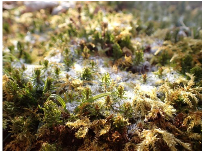
コケに積もる氷の粒

●建て替え工事をしていた畦ヶ丸避難小屋が令和2年10月16日に供用開始となりました。小屋はとてもきれいに使用していただき、木の香りもよく心地の良い空間でした。寒さが厳しいこの季節、ぜひ休憩等にご利用下さい。