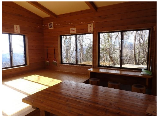
窓が多く明るい内部