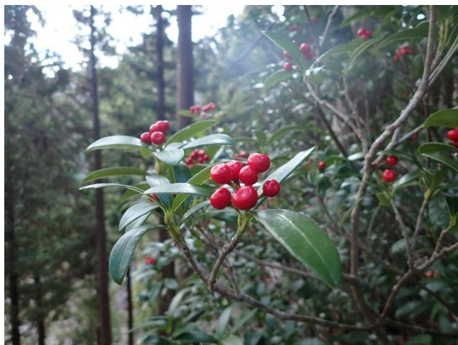
ミヤマシキミの実