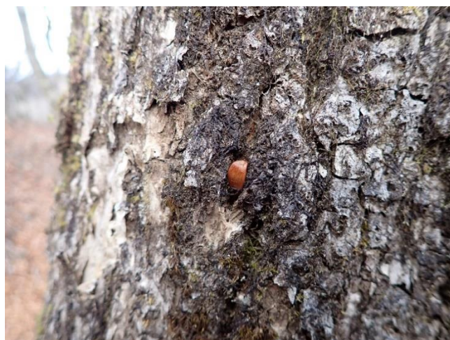
樹皮の隙間のブナの実

●木の樹皮に挟まったブナの実を見つけました。ゴジュウカラの仕業でしょうか。ゴジュウカラは、木の幹を頭を下に向けて歩くという特技の持ち主です。冬に備えるため樹皮の隙間等に木の実を蓄える習性があります。この日も、フィーフィーと鳴き声が聞こえていました。