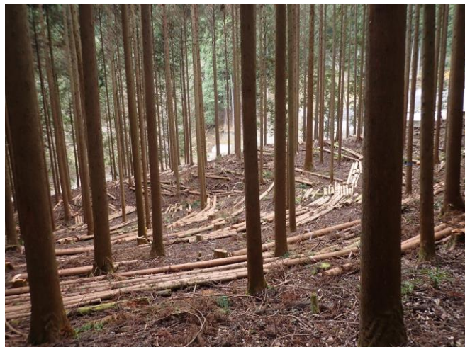
間伐された人工林

●二本杉峠から細川橋間は人工林の中を歩きます。間伐がされ林内に光が差し込んでいました。権現山はミツマタの花で知られていますが、光環境がよくなりミツマタもさらに元気に成長するとよいですね。