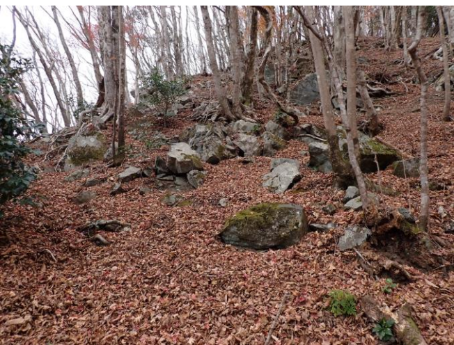
落ち葉に覆われ踏跡が不明瞭な登山道