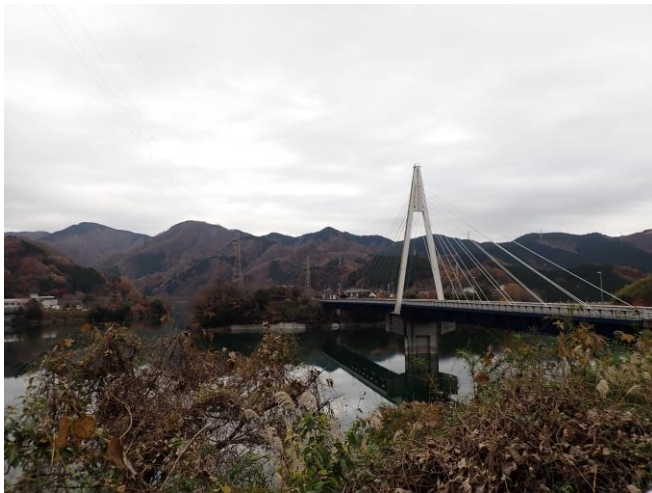
丹沢湖畔から登山開始

●浅瀬入口から権現山までは、踏跡が不明瞭な箇所や作業路と接する箇所があるため、道迷いしやすく注意が必要です。特に、落葉の時期は登山道に落ち葉が積もり道が分かりにくくなっています。地図や指導標等で位置をよく確認しながら進みましょう。