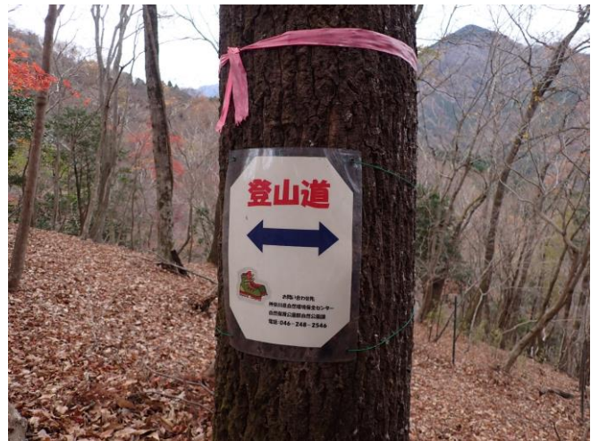
登山道を示す看板