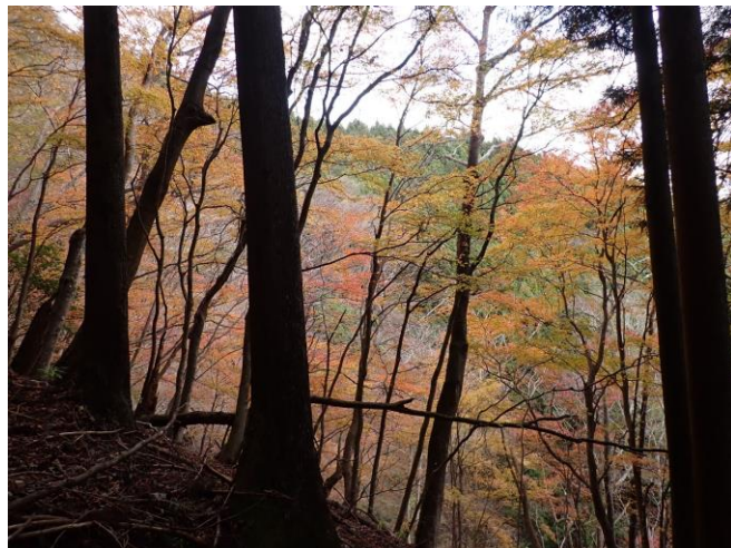
権現山中腹では赤や黄色の紅葉がまだ少し残っていました

●二本杉峠から細川橋間は人工林の中を歩きます。間伐がされ林内に光が差し込んでいました。権現山はミツマタの花で知られていますが、光環境がよくなりミツマタもさらに元気に成長するとよいですね。