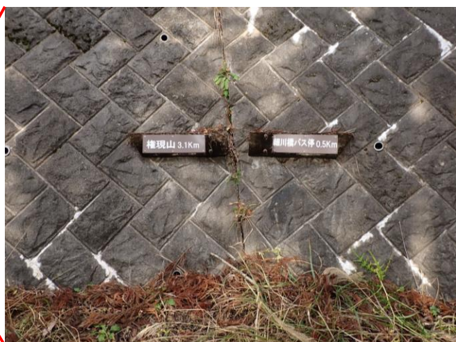
壁面にある指導標