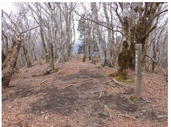
木々に覆われた権現山山頂