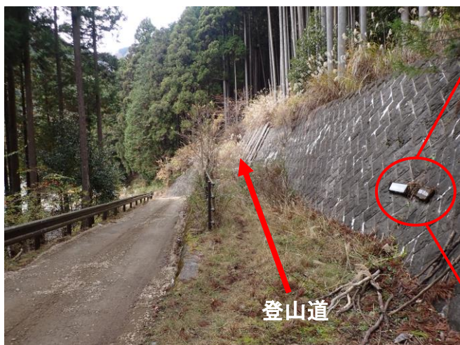
林道からの分岐地点

●細川橋から入山の場合、林道から登山道に入る所の指導標を見落とさない様注意しましょう。