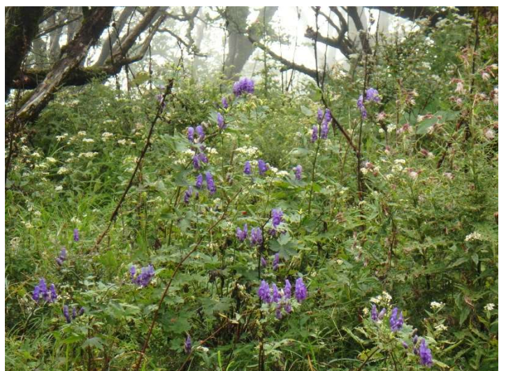
トリカブトの仲間