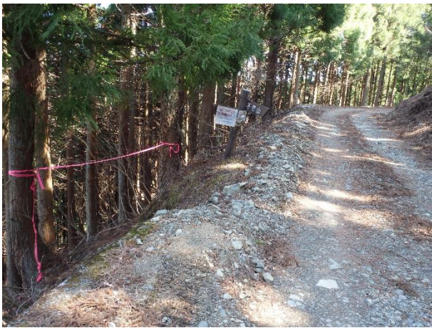
（写真 1）浅瀬橋への登山道・通行止め