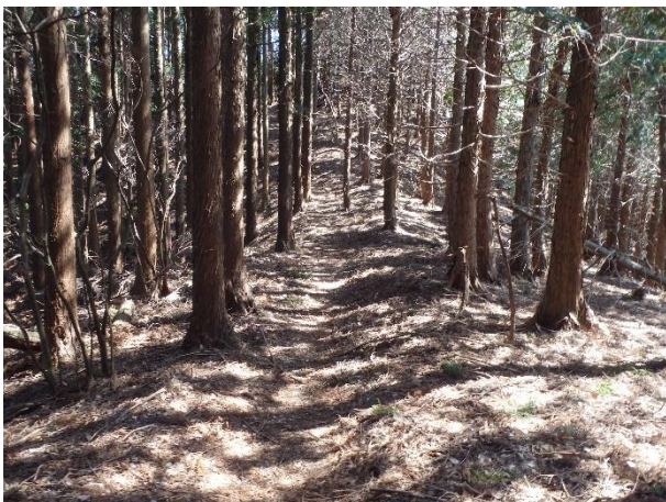
（写真 2）なだらかな人工林内