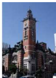
「ジャック」 横浜市開港 記念会館