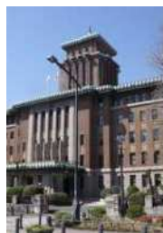
「キング」 県庁本庁舎