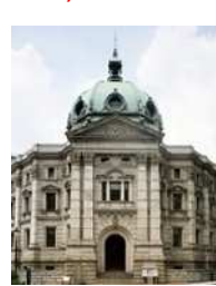
「エースの ドーム」 県立歴史博物館

三塔の日（平成25年度は平成26年3月9日（日））に 神奈川フィルにより、各会場でタイプの異なるコンサ ートなどを開催(予定)