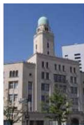
「クイーン」 横浜税関