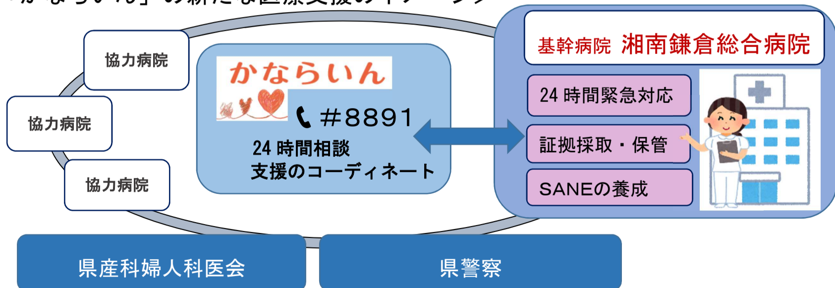
＜「かならいん」の新たな医療支援のイメージ＞

SANE（セイン）：心身に傷を負った性暴力の被害者に適切なケアを提供するための訓練を受けた看護職（保健師・助産師・看護師）。(Sexual Assault Nurse Examiner)