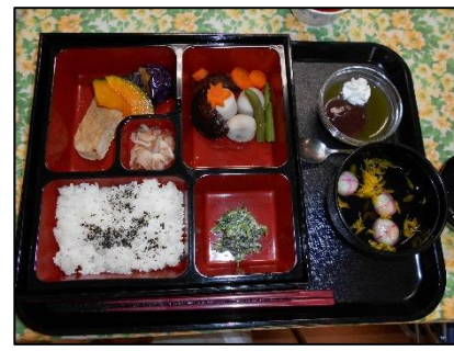
大量調理実習(常食、弁当形式)