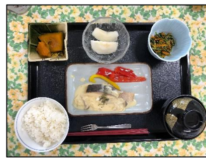
大量調理実習(常食、定食形式)