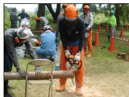
チェーンソー運転実習