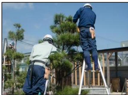
樹木の整枝・剪定実習