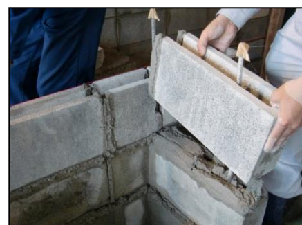
ブロック施工実習