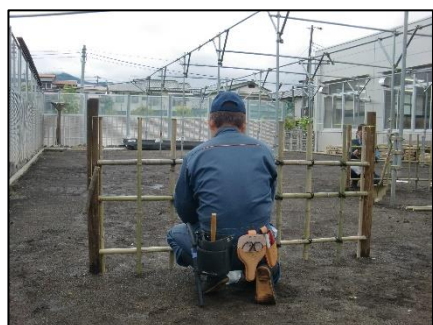
垣根施工実習（四ツ目垣）