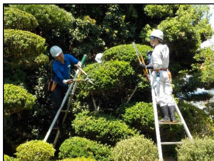
樹木の整枝・剪定実習