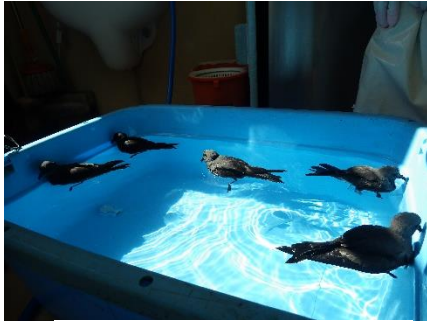
コシジロウミツバメ