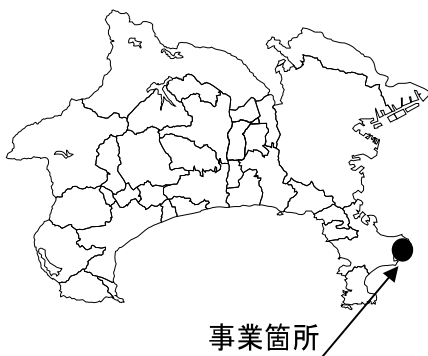
浦賀かもめ団地 位置図